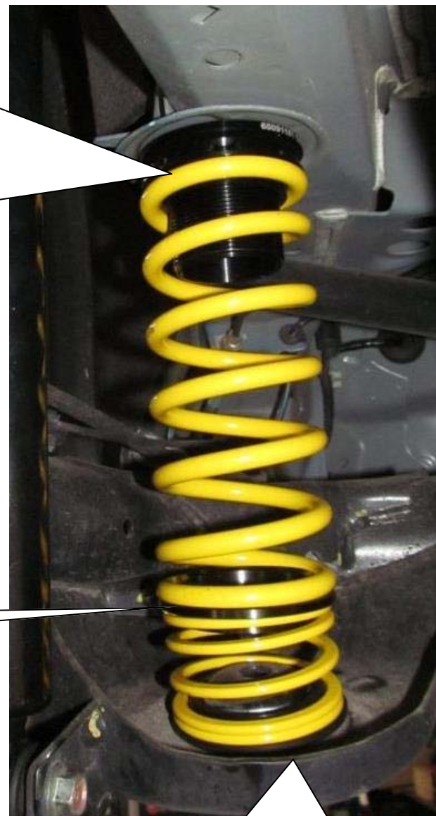
Zwischenring Intermediate ring

Mount the rear axle adjustment between spring and chassis, the original spring support is no longer used. You have to remove the rear axle adjustment to correct (screw up the threaded ring) the car height. Attention: Before the installation of the height adjustment perch the touching surface area have to be cleaned. Do not over tighten the set screw. Maximum torque is 2 Nm (1.47 ft-lb).