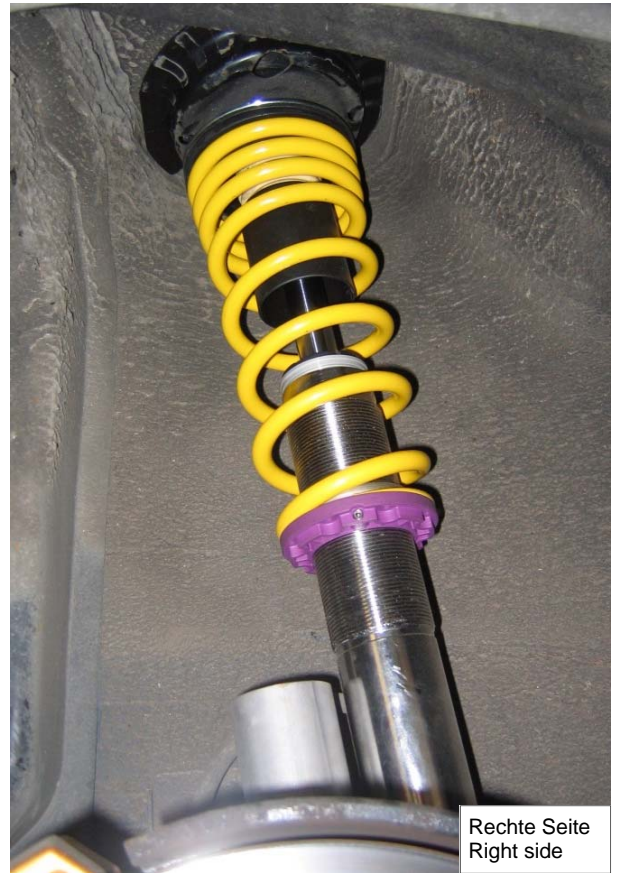
Rechte Seite Right side