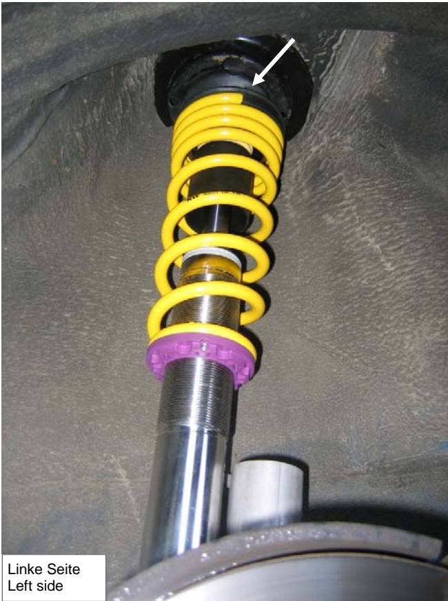
Linke Seite Left side

The upper end of the spring must show towards the left vehicle side.